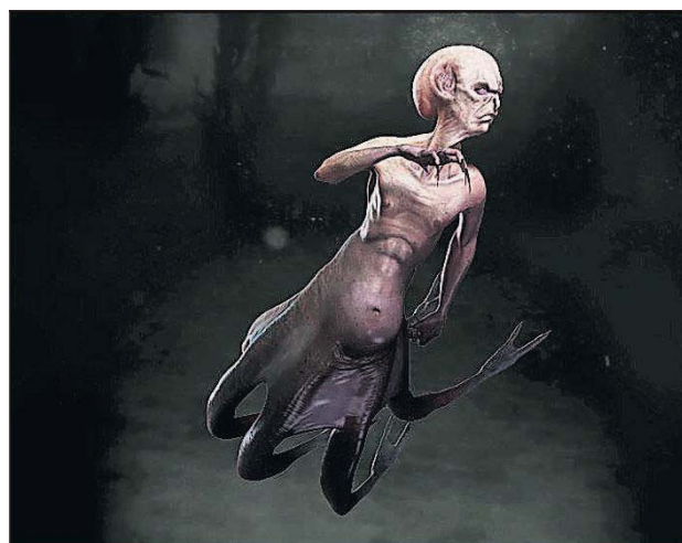
Een beeld uit het filmpje dat Boskma als afstudeerproject produceerde.