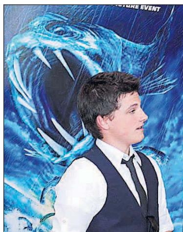
Acteur Josh Hutcherson bij de poster voor de film 'Journey to the Center of the Earth'.

Zelf zag hij de hele film voor het eerst in Londen. Vanwege de effecten moesten alle bioscoopbezoekers een speciale bril opzetten. „Het was echt ontzettend cool om je eigen monsters van het scherm te zien spatten. En om onbekenden enorm te zien schrikken van mijn beesten. Daar doe je het voor.”